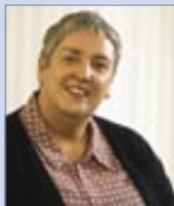
Anne Nee Éascaitheoir Lonnaithe i mBord Sláinte an Oirdheiscirt