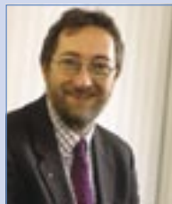
Seosamh Ó Maolalaí Éascaitheoir Lonnaithe sa Phríomhoifig